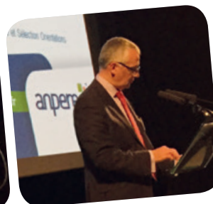
↳ Hervé Raquin